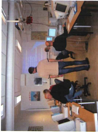
IT-møte på SLHK

Litt forhåndsinfo på et klubbmøte før besøket vil være positivt både for utbytte av besøket og for oppmøteprosenten på bedriftsbesøket.