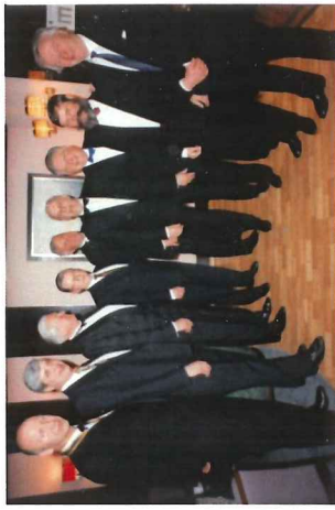
9 av de 10 første presidentene

Oppmøte prosenten kunne ha vært høyere i denne perioden for vår klubb. Den har i perioder ligget mellom 40-45 prosent, men per 31.mai 2011 ligger den på 52 prosent, således at vi kan konkludere med at oppmøte er stigende.