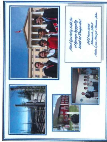
Takk for besøket fra Minnesota