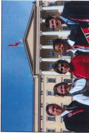
17. mai foran Slottet