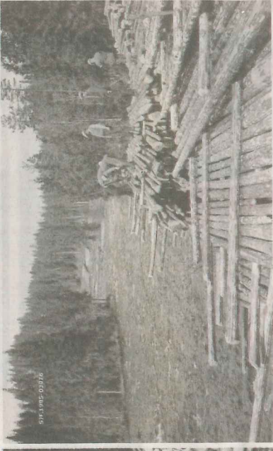
Utislag av barket tømmer fra strovelter ved elva Vala i Nordarhov på Rin.

I dette tilfellet er filmen finansiert med støtte fra sparebankstiftelsene, skogbruket og industrien, sier Fuglum, som forteller at rotaryklubben sto ved et veiskille i 2013.