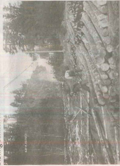
Lastebil og tømmer - digitalmuseum