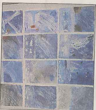
FOSSEN: Elevene hadde laget flotte tegninger.

Hønefoss-Ringerike Rotaryklubb har planer for fortsattelse av dette viktige kulturhistoriske